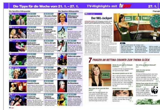
z.B. Programmsponsoring (Beispielhafte Umsetzung)