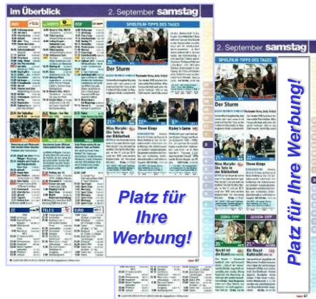
z.B. Werben im Programm

Weitere Informationen finden Sie auch unter: www.bauer-extras.de